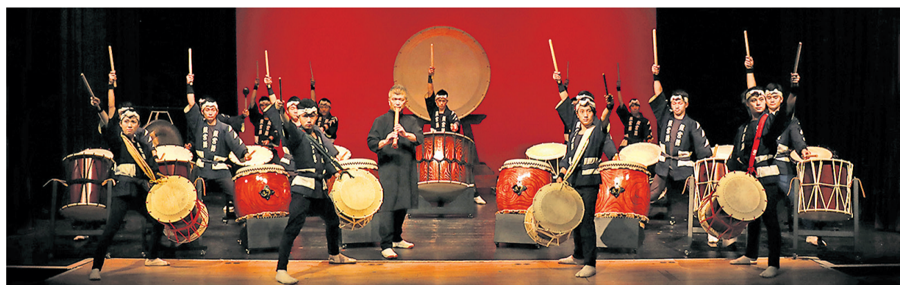
Die Taiko-Trommler aus Osaka begeistern mit furiosen Rhythmen und kraftvoller Athletik.